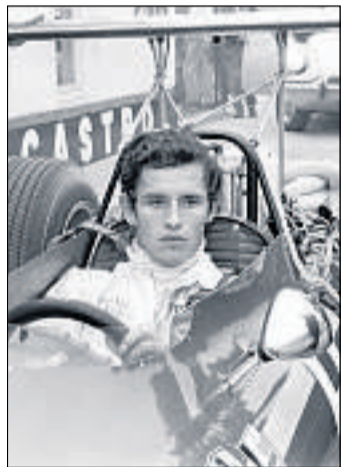
Jacky Ickx 1968 im Rennwagen. Der als Gentleman-Fahrer und Regenspezialist bekannte Franzose war neben Jochen Rindt und Jackie Stewart der Star in der Formel 1.